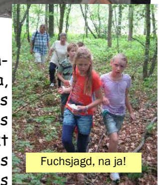
Fuchsjagd, na ja!

Der Dienstag stand unter dem Motto: „Ein Besuch im Zoo“. Mit dem Bus ging es zum Hauptbahnhof und dann rein ins Vergnügen. Ob Roter Panda, Schneeleopard, Pinguine, Eisbären, Affen usw. nichts wurde ausgelassen. Nachdem sich alle mit Pommes und/oder Brezeln gestärkt hatten war zum Abschluss auch hier der Spielplatz das Ziel. Zurück im Clubhaus blieb noch Zeit für ein Fußballmatch, bei dem auch die Mädchen furchtlos mitspielten.