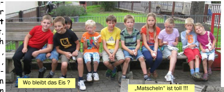
Wo bleibt das Eis ?